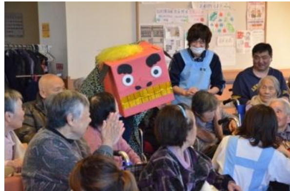
「正月から縁起のいいものが見られて良かった。」 AM様

職員による獅子舞の踊りや、利用者様対抗の福笑いゲームを行いました。福笑いは、完成後の利用者様の笑い声や笑顔が印象的でした。 ケアマネージャー 持田