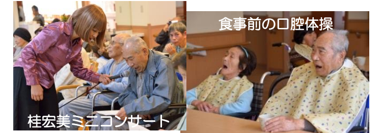
食事前の口腔体操