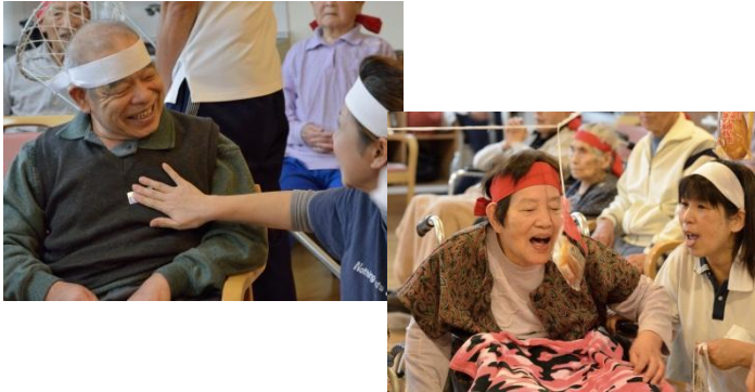
「玉入れ、たくさん入れたぞー」 MT様

紅白に分かれて玉入れやパン食い競争、輪投げを行いました。チーム丸となって勝利を目指し頑張りました。 介護職員 小林