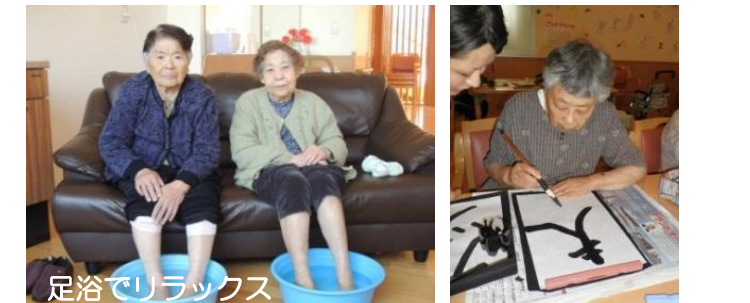
足浴でリラックス