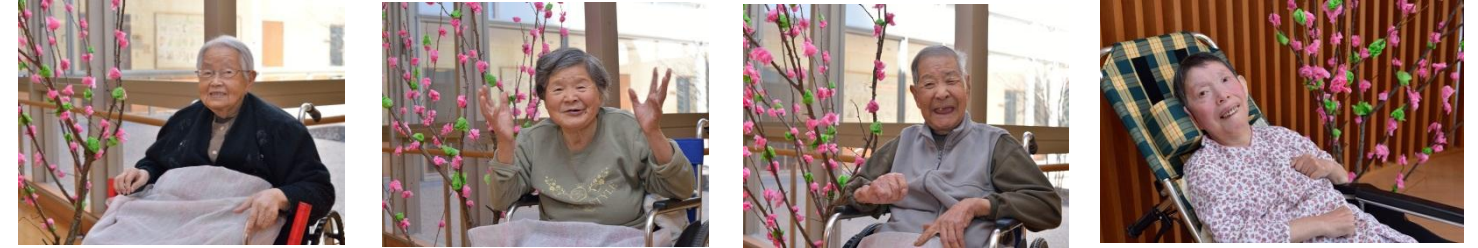
「きれいに撮ってよ」 AM様 手作りの花を背景に利用者様全員素敵な写真を撮ることができました。当日は一年間の行事をスライドショーで楽しみ、笑顔が印象に残る会となりました。 介護職員 石川