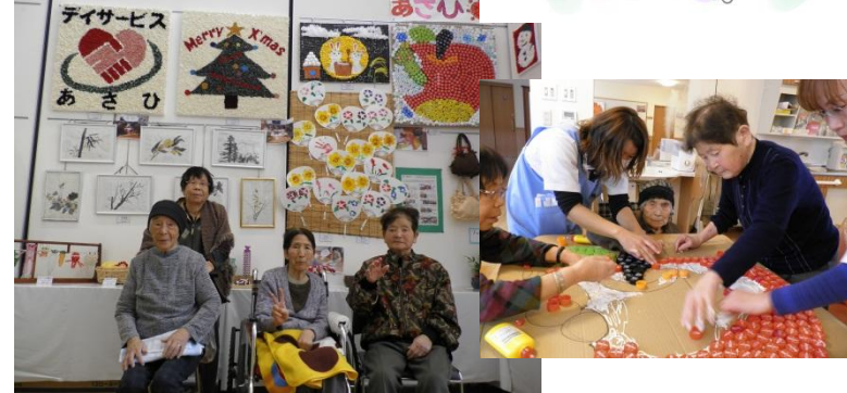
「みんな良くできてるね〜」 SN様

ご自身の作品を嬉しそうに眺めている表情が印象的でした。他の施設の利用者様の作品も一生懸命に作られている姿が想像できる、すばらしい作品でした。 介護職員 森口