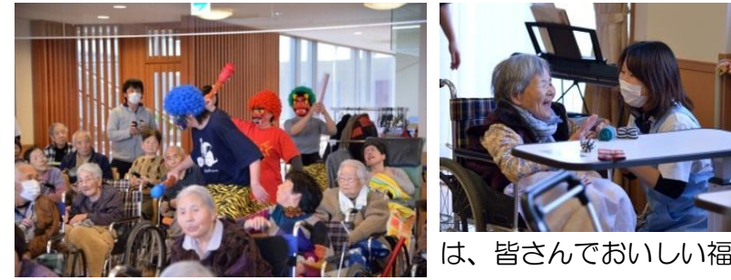
「家族が、怪我や病気なく元気に過ごせますように。鬼は外〜」 YF様

赤、青、緑鬼の登場に「鬼は外」と豆（利用者様が新聞を丸めて作った物）を投げる手に力が入ります。会が終わった後は、皆さんでおいしい福茶をいただきました。 介護職員 廣田